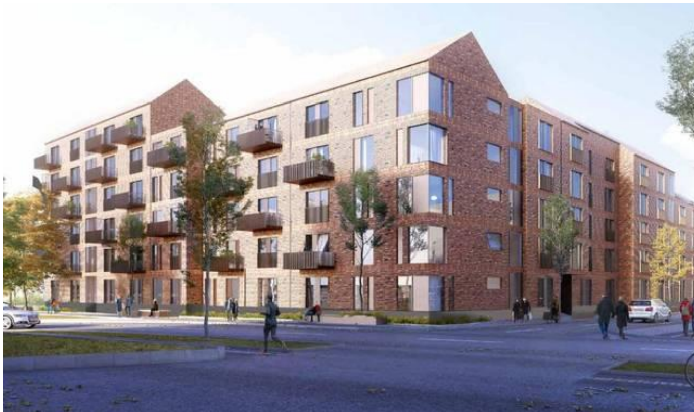
Illustration af projektet set fra Langelandsgade/Katrinebjergvej. Illustration: Casa Group